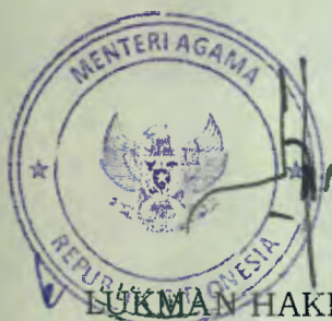
LUKMAN HAKIM SAIFUDDIN