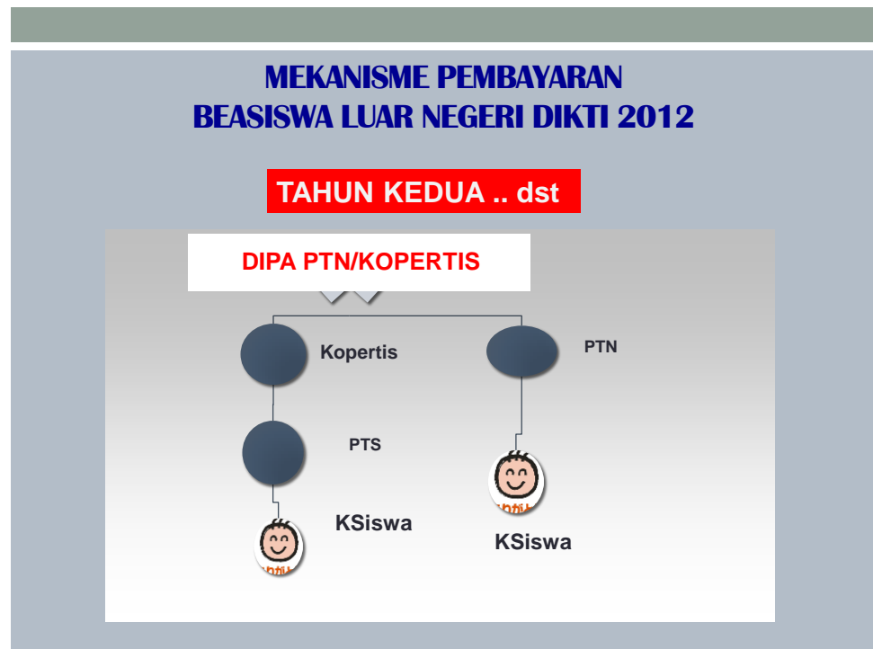
Gambar 3 Mekanisme Pencairan BLN pada tahun ke-2