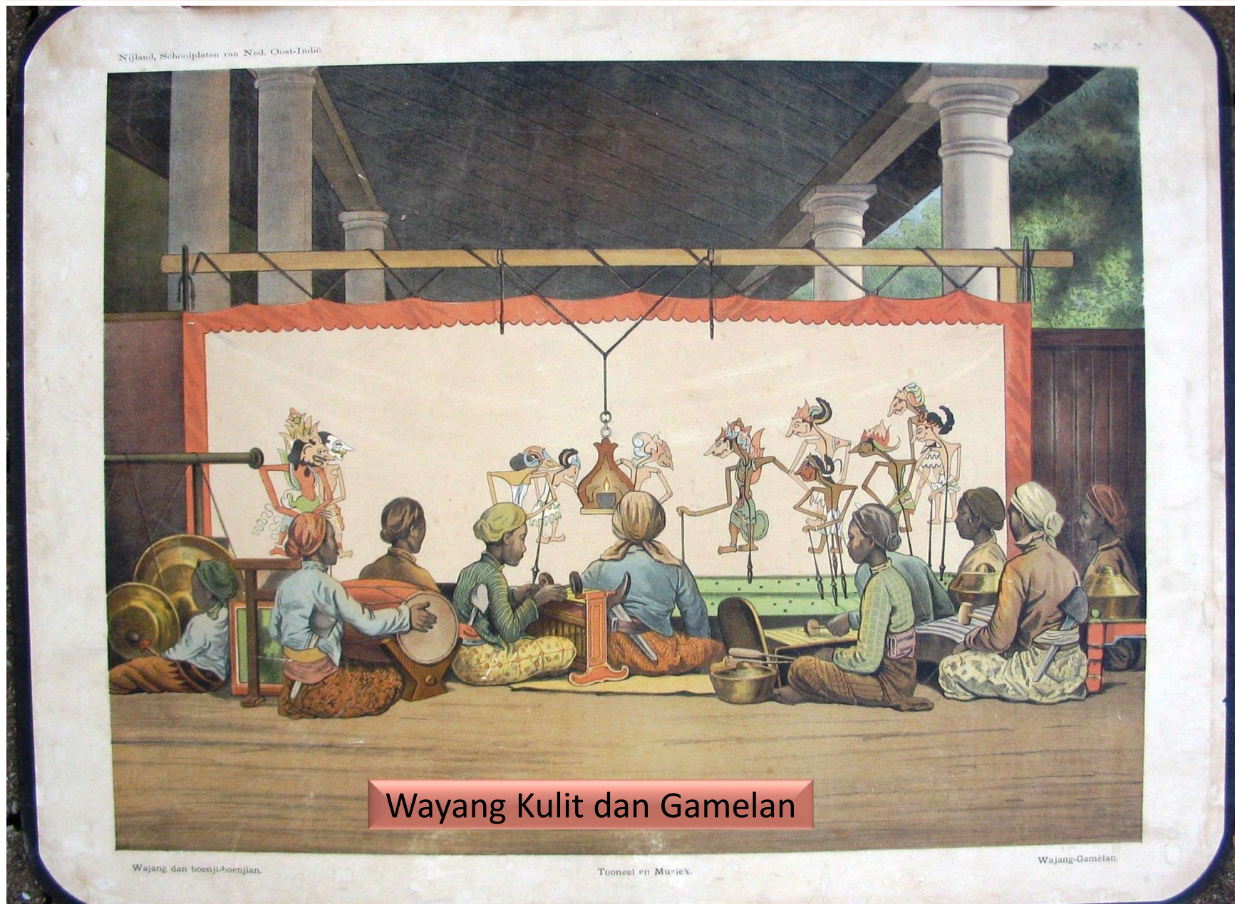
Wayang Kulit dan Gamelan

1897: E. Nijland ( E.J. Brill , C.H.E. Breijer )