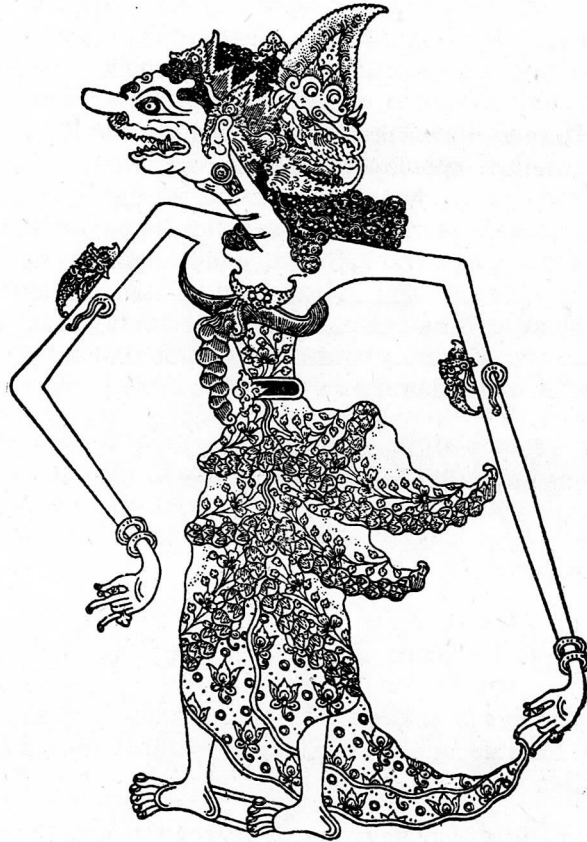
Dewi Ngruni santun warnidiyu.